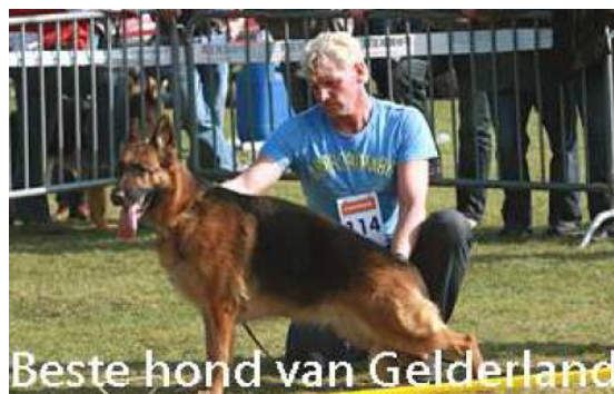
Anouk von Jurgentij Beste kynologische hond uit Gelderland PCM2009