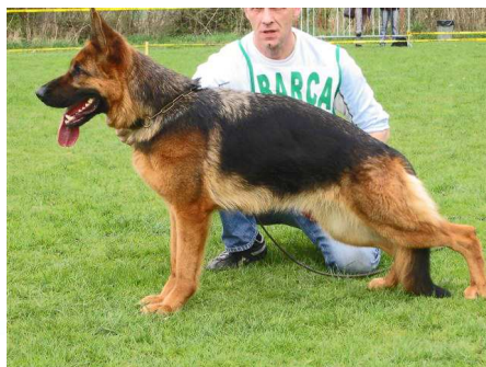
Dalida v. Frankengold Beste kynologische hond Gelderland PCM 2008