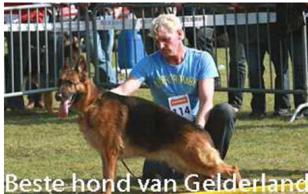
Anouk von Jurgentij Beste kynologische hond uit Gelderland PCM2010